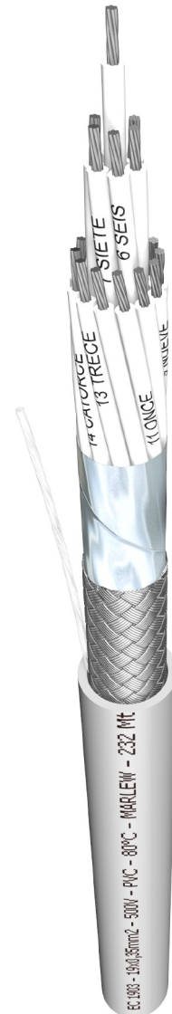
EC ARCOMP® Multipolar blindado con cinta + trenza